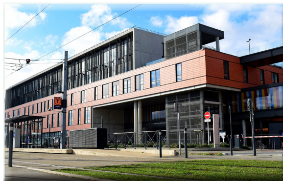
Bâtiment URM, site de Purpan

Conception : Équipe de l'Unité d'Accueil et de Soins pour Sourds-Langue des signes Création Graphique : Direction de la Communication – Mise à jour : mars 2022 Impression : Centre de Reprographie du CHU de Toulouse © 2007, CHU Toulouse - 2, rue Viguierie - TSA 80035 - 31059 Toulouse Cedex 9